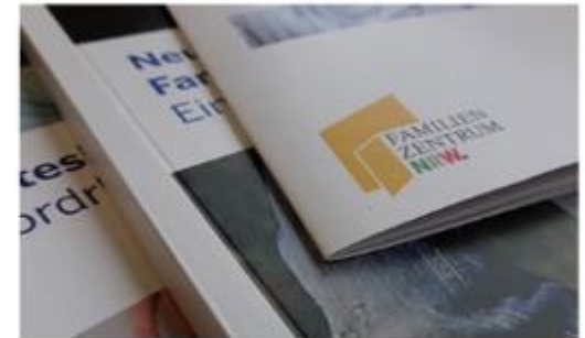
Informationen & Material