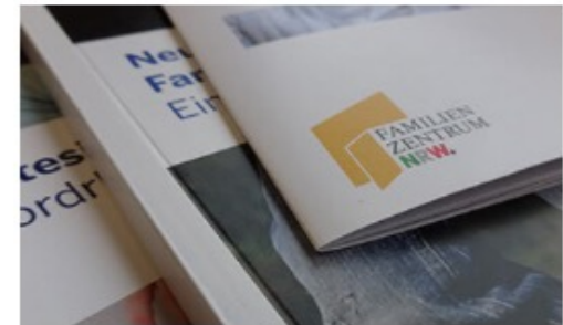
Informationen & Material