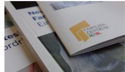
Informationen & Material